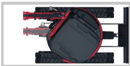
Radio giro 0°