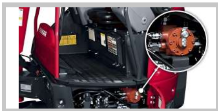
4 modos de trabajo