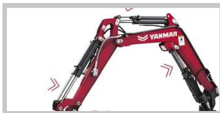
Protección en todos los cilindros hidráulicos